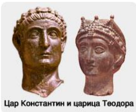
Цар Константин и царица Теодора

После Дарданаца и Келта, који су граду дали име Наиссус (Вилин град), Ниш је у античком добу био снажан, неосвојив каструм. Протоломеј га под тим именом први пут спомиње 140. године како једног од четири највећа града Дарациније. Под зидинама римског Наиссуса, цар Клаудије је потукао Готе 269. године.