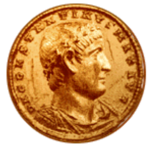
Новац Цара Константина

Ниш је раскрсница балканских и европских путева, други по величини у земљи после Београда, седиште Нишавског округа, који повезује Европу са Блиским Истоком, један од најстаријих градова на Балкану, који од давнина важи за капију Истока и Запада. Шире подручје Ниша било је насељено још у неолиту, у рано бронзано доба. У Археолошком музеју Ниша чувају се праисторијски налази са локалитета Бубањ чука из периода 4000 година пре нове ере.